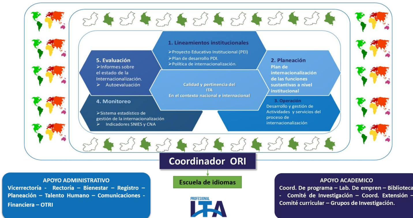
MODELO DE INTERNACIONALIZACION DE LA INSTITUCION DE EDUCACION SUPERIOR ITA